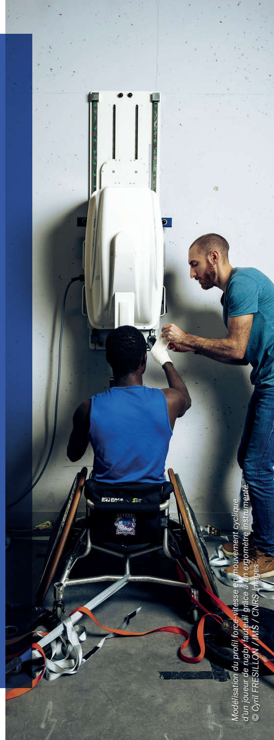
Modélisation du profil force-vitesse en mouvement cyclique d'un joueur de rugby fauteuil grâce à un ergomètre instrumenté.